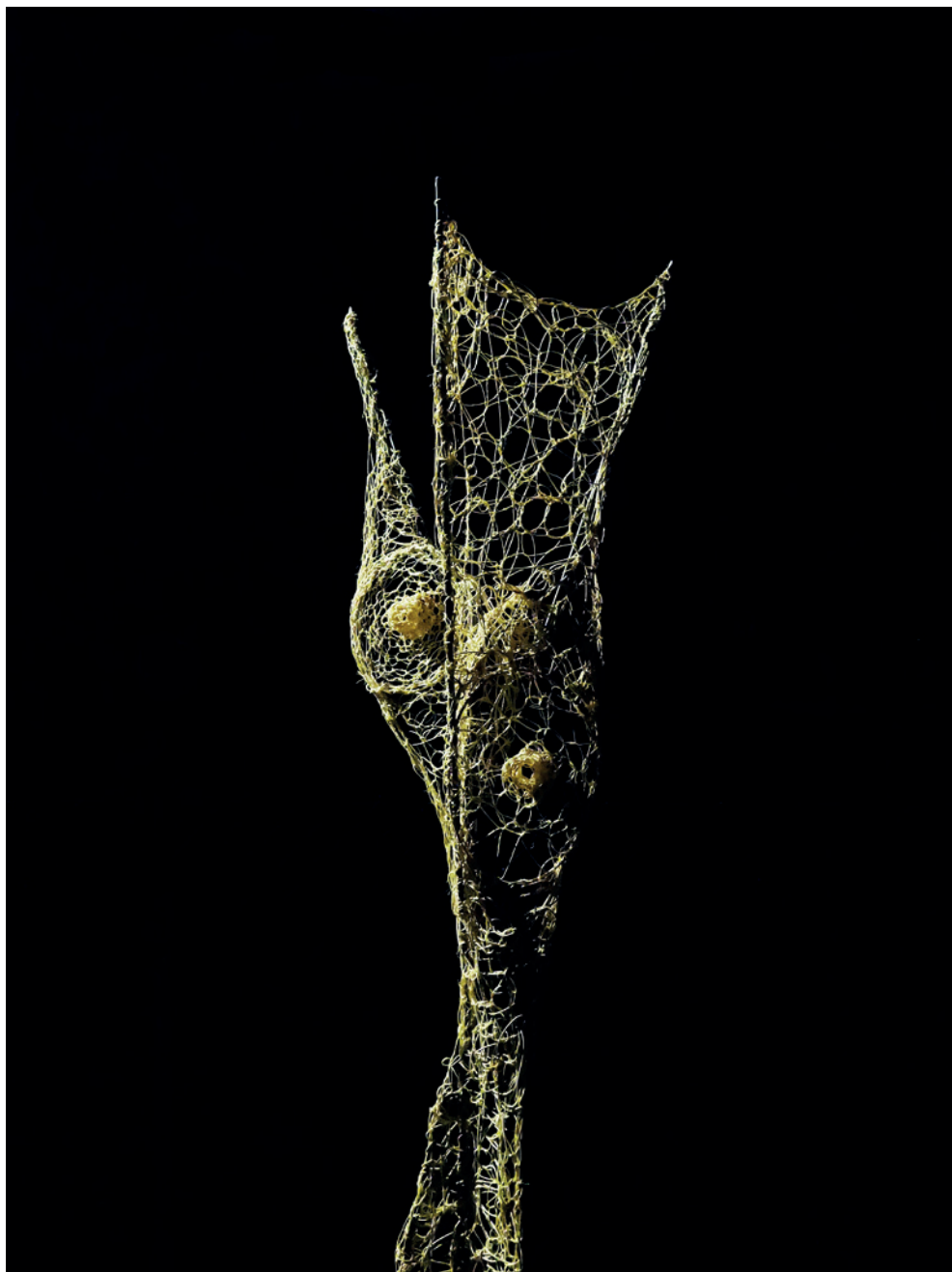
Spiatoi , 2021 (particolare) serie di 6, tondino di ferro, spago, sisal, midollino dimensioni ambientali variabili, cm 210 x 70 x 70 circa