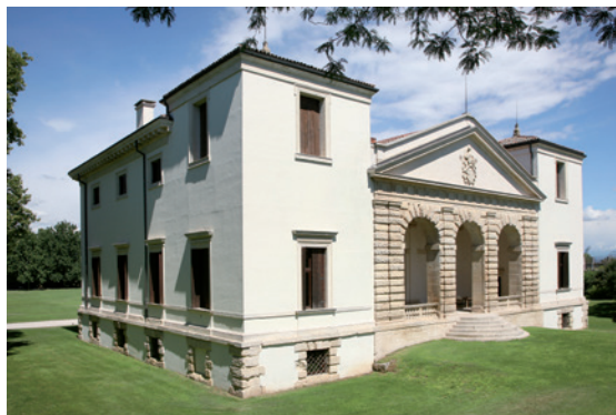
VILLA Pisani Bonetti è un Bene UNESCO Patrimonio Culturale dell'Umanità