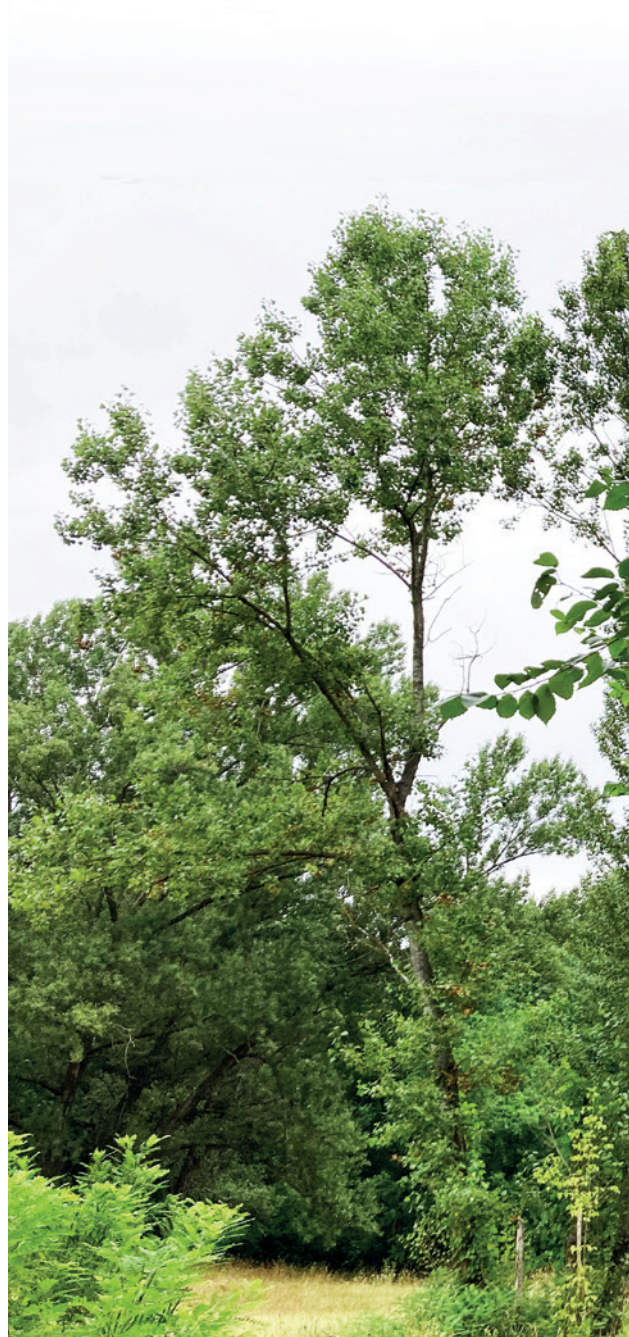
Innesti, 2021 ferro, sisal, midollino, spago, salice con scorza dimensioni ambientali