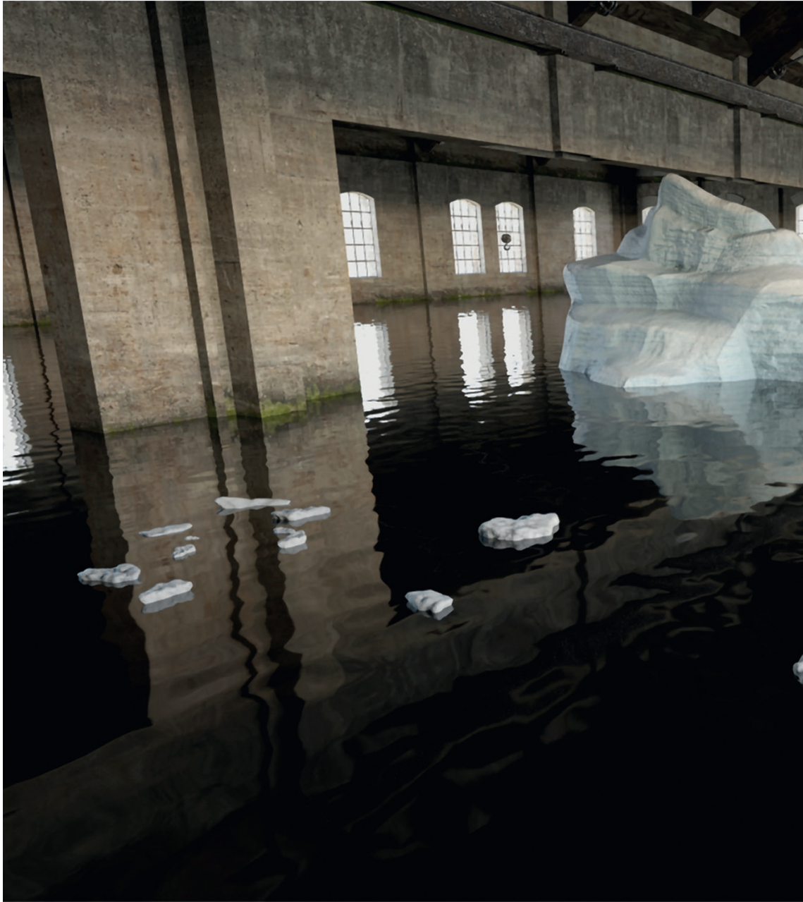
Where The Lost Things Are , 2019 video-installazione