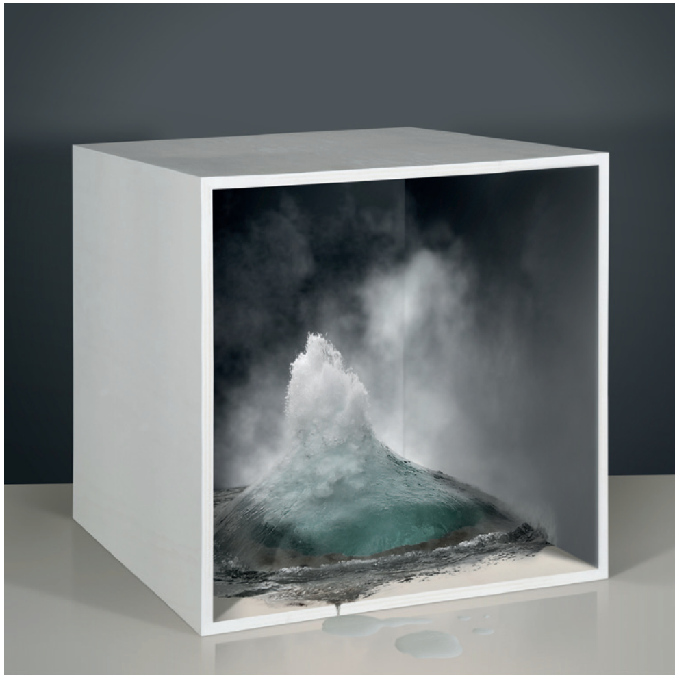
Empty Spaces #4 , 2014 stampa lambda su pellicola Duratrans - lightbox, basamento in legno verniciato cm 48 x 85 x 120