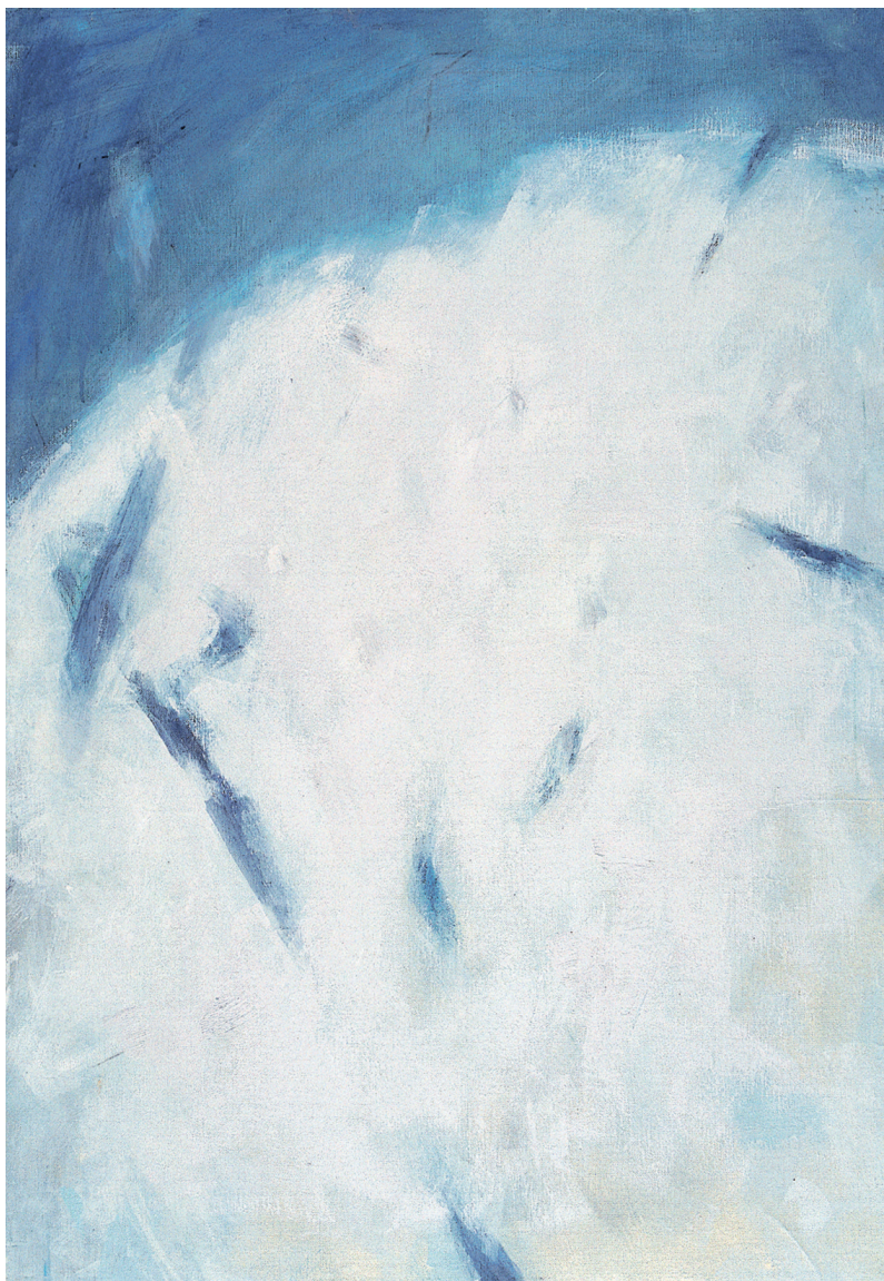
MARIO RACITI "Mistero" , 2002 tecnica mista su tela - cm. 100 x 70