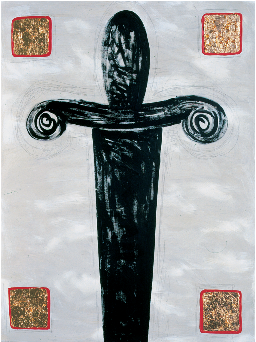
MANUELA BEDESCHI “Il grande stiletto”, 2001 - tecnica mista, cm. 230 x 170