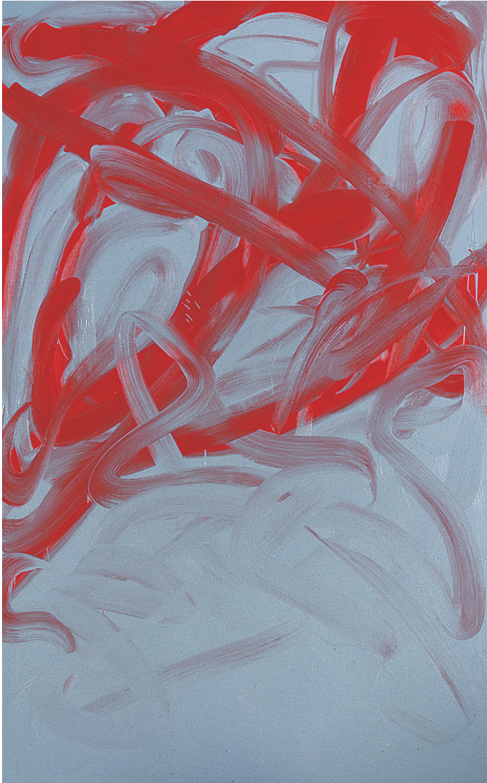
SERGIO SERMIDI "Al termine", 2000 - cm. 240 x 150