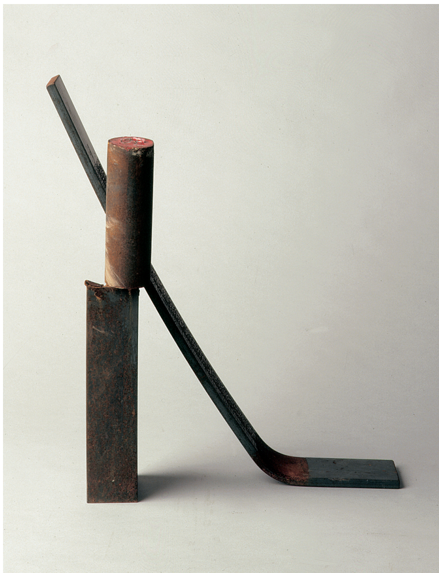
RITA SIRAGUSA “La pausa”, 1999 - ferro, cm. 22 x 65 x 55