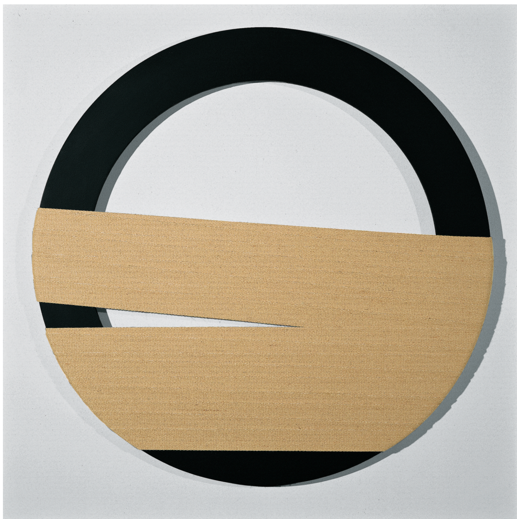
“Untitled”, 2001 legno, corda, acrilici, Ø 80 cm