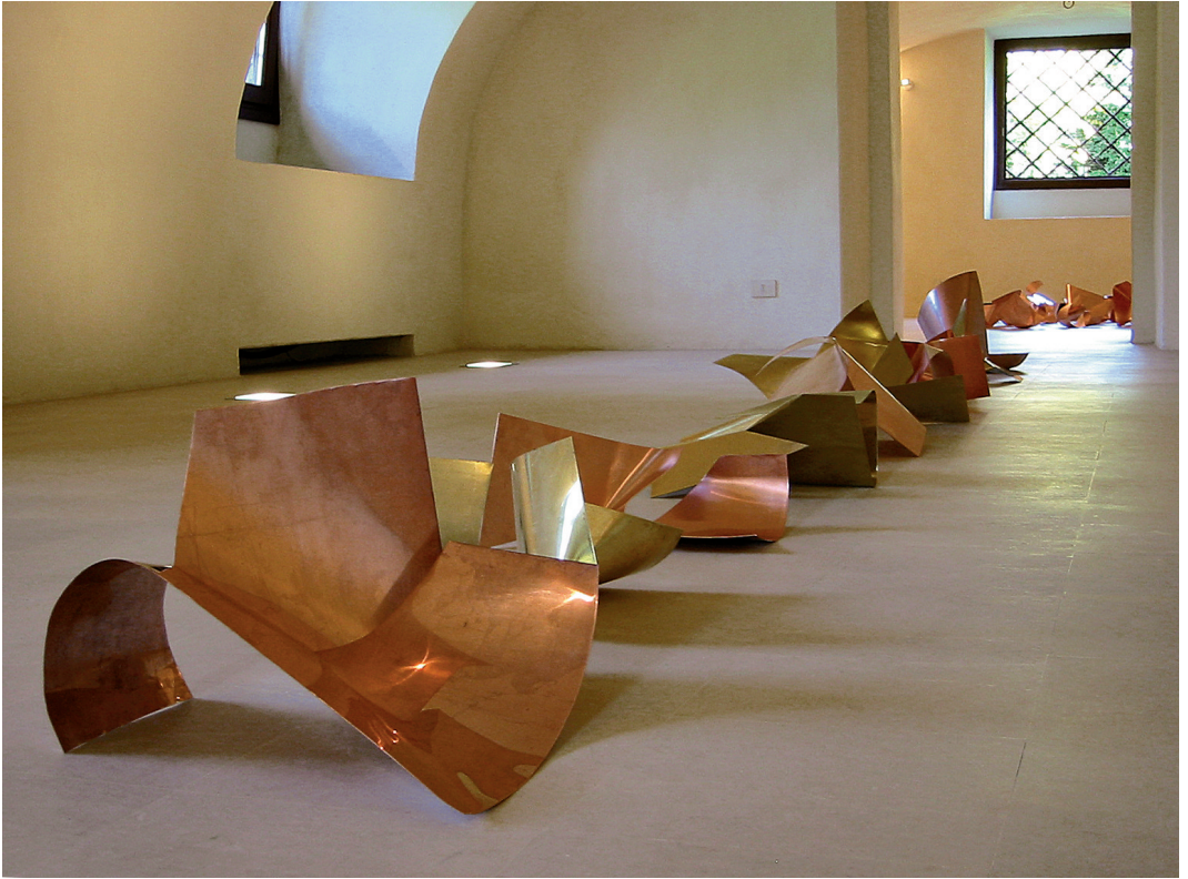
“Senza titolo”, 2005 rame, ottone